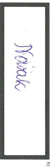
(własnoręczny podpis wnioskodawcy (nie wykraczać poza ramkę))