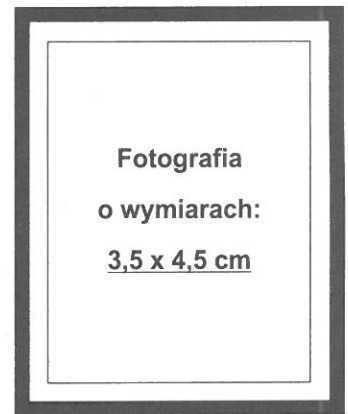
(nie wykraczać poza ramkę wewnętrzną)